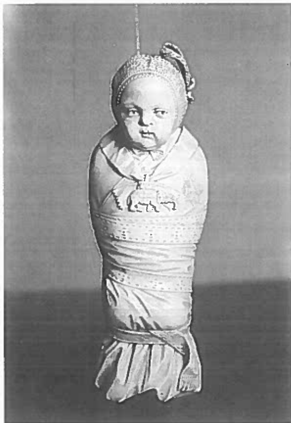
Elfenbensfigur af arveprins Frederik i helsvøb 1753. Under den meget smalle svøbeliste ses svøbet tydeligt. (De Danske Kongers Kronologiske Samling, Rosenborg Slot).

At der også har været praktiseret en anden udgave af helsvøbet tyder en lille elfenbensfigur af arveprins Frederik fra 1753 på (8). Den lille prins er svøbt fra hals til fod, men svøbelisten er ganske smal og kun viklet nogle få gange om kroppen, og svøbet ses ganske tydeligt under listen. Denne form for svøbning med smalle lister sidder antagelig ikke helt så stramt som med en bred liste.