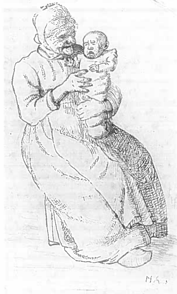
Et svøbelsesbarn i halvsvøb med armene fri fra 1873. (Michael og Anna Anchers hus).